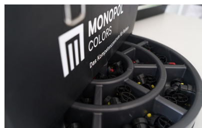
Têtes de pulvérisation Flexjet et conventionnelle