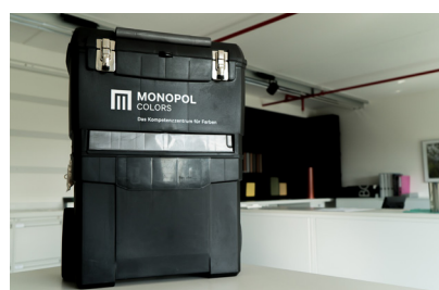
Mallette sur roulettes pour un transport aisé

Lors de votre commande de peinture, indiquez le nombre de bombes de réparation souhaitées. Leur contenu est tiré du bidon et les bombes peuvent directement être ajoutées à la mallette de réparation. Sans commande d'une peinture de finition, le contenu doit être mélangé spécialement, ce qui entraîne un surcoût important.