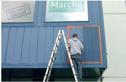
September 2010 Testfläche auf der ausgekreideten Fassade