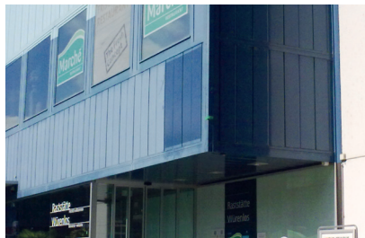
September 2010 Deutlicher Unterschied vorher und nachher