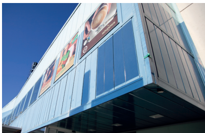
September 2013 Nach drei Jahren keine Farbveränderung und kein Glanzverlust